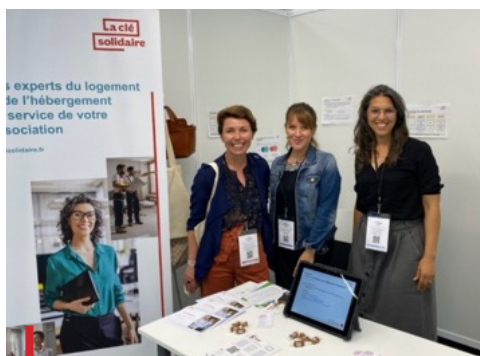
Congrès de la FAS à Rennes, les 15 et 16 juin 2022

Le plan de communication 2022 avait pour objectif le développement de la notoriété de La Clé Solidaire et de son offre de services, en particulier le dispositif d'aide au financement des diagnostics thématiques lancé fin 2021.