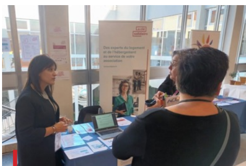
Congrès de l'UNAFO à Marseille, les 22 et 23 novembre 2022