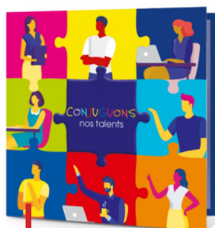
Conjuguons nos talents, carte de vœux 2023 (Fondation Abbé-Pierre)